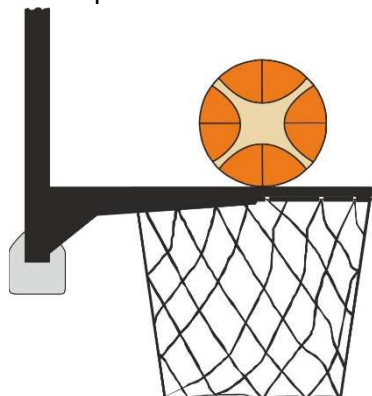
Obrázek 2 Míč v kontaktu s obroučkou

31 - 18 Ustanovení. Srážení míče nastává, když se během střely na koš z pole obránce nebo útočník dotkne desky nebo koše (obroučky nebo sítky), zatímco je míč v dotyku s obroučkou a má možnost padnout do koše.