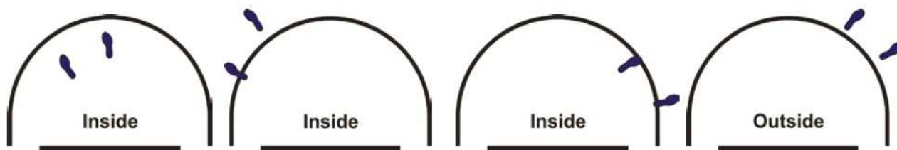
Obrázek 4 Postavení hráče uvnitř/vně území půlkruhu proti prorážení

33 - 4 Příklad: A1 začíná pokus o střelu z výskoku, který zahájí mimo území půlkruhu prorážení, a vrazí do B1, který je v kontaktu s půlkruhem proti prorážení.