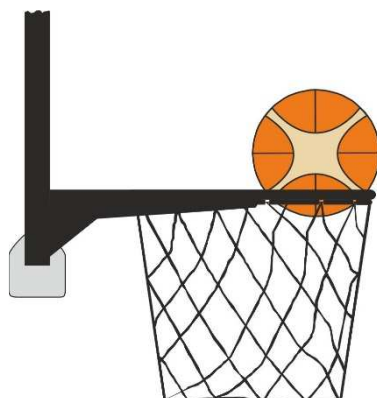
Obrázek 3 Míč v koši

31 - 24 Ustanovení. Jestliže se bránící hráč dotkne míče, který je v koši, je to přestupek.